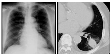
肺がんの早期発見